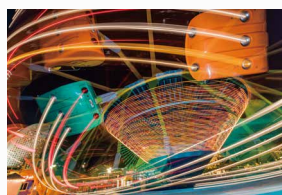
焦距: 15mm 曝光: F/6.3 1秒 ISO200

为了完全发挥镜头所拥有的优异光学性能,微小的抖动或失焦在可能的范围内一定要降到最低。为此,镜头搭载了“双MPU”处理器,2个处理器分别专门用来控制自动对焦镜片与防抖系统。自动对焦的速度、精度得以提高,防抖效果也较以往产品大幅提升至4.5档* (CIPA标准)。即使在低照度环境下手持拍摄,也能有效降低抖动的影。